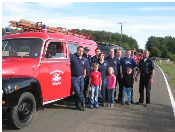
Die Mitglieder des Feuerwehrmuseums vor der Abfahrt der Löschfahrzeug-Kolonne.

Anlässlich des Hermeskeiler Bauernmarktes war das Museum mit einer Ausstellung auf dem Neuen Markt vertreten. Hier wurde erneut der heimischen Bevölkerung gezeigt, welche hervorragende Exponate im Hermeskeiler Feuerwehrmuseum gezeigt werden.