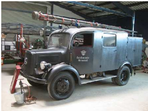
Unser „Fernsehrstar“, das LLG im Feuerwehrmuseum Hermeskeil.

Ebenso wurde ein kleines Kinderprogramm angeboten. Es zeigte sich, dass gerade viele junge Familien diesen Sonntag Nachmittag zu einem Besuch im Museum nutzten.