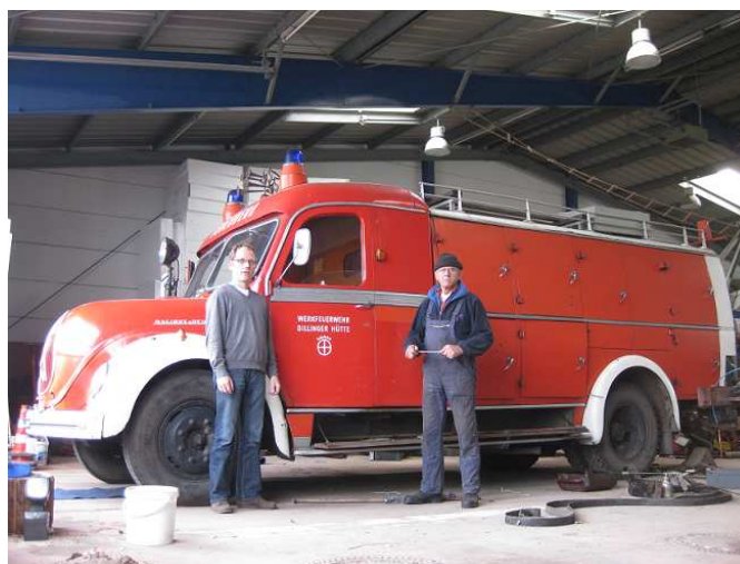
Der neue Hilfsrüstwagen des Museums vor der Restaurierung.

Im Herbst des Jahres erhielt das Feuerwehrmuseum von der Dillinger Hütte / Saarland einen Hilfsrüstwagen (HRW) aus dem Jahre 1955. Hierbei handelt es sich um ein sehr interessantes Fahrzeug mit eingebautem Stromgenerator, CO 2 -Löschanlage und Kran. Auch das Fahrerhaus ist hoch interessant. Besonders auffällig ist, dass links neben dem Fahrer noch ein Sitzplatz ist, so dass fünf Wehrmänner im Fahrzeug einen Platz hatten. Ursprünglich war das Fahrzeug bei der Feuerwehr Dillingen im Dienst. Auf Nachfragen hat das Museum von dort bereits „historische“ Bilder des HRW erhalten.